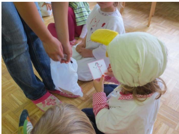
Slika 7: Žrebanje kartic Plešem!