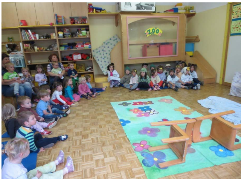
Slika 10: Gledalci in igralci na odru

razdelila presenečenje (piškote) smo si odšli v veliko dvorano pogledat posnetek današnje predstave. Ogledali smo si ga na projektorju, da so vsi otroci dobro videli. Na koncu sem jih vprašala ali bi še kdaj kakšno pravljico tako zaplesali in vsi so se strinjali. S predstavo sta bili zadovoljni tudi vzgojiteljica in pomočnica vzgojiteljice. Obe sta se strinjali, da so se otroci med predstavo umirili, saj so drugače precej živahni. Odločili sta se, da bosta še kdaj izvedli plesno dramtizacijo.