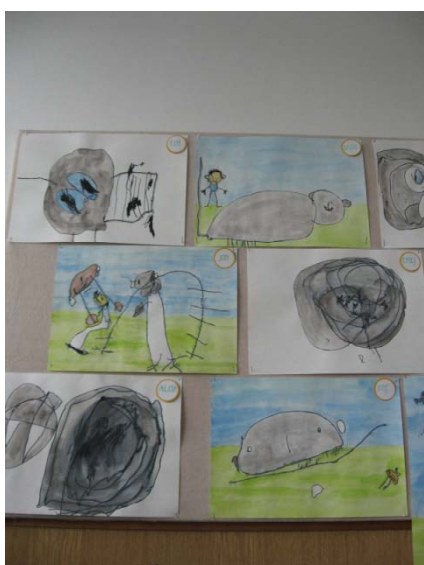
Slika 4: Risbe - volk