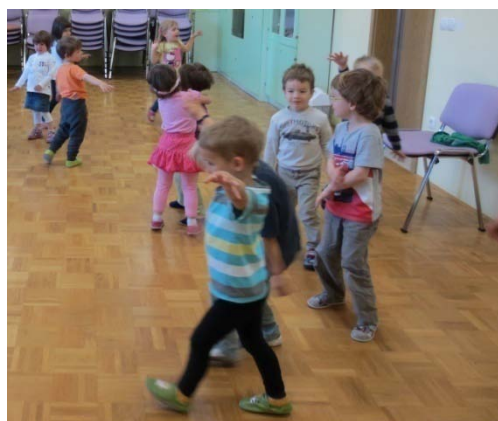
Slika 6: Gibanje ptičev