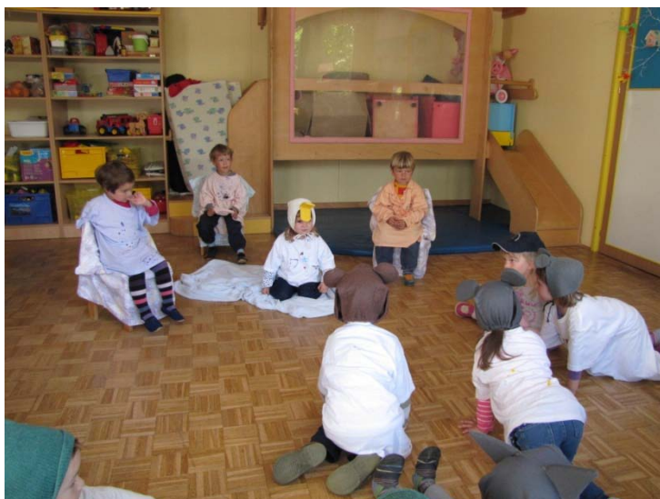
Slika 8: Uprizarjanje pravljice

V četrtek so otroci uprizorili predstavo otrokom iz sosednjih dveh igralnic.