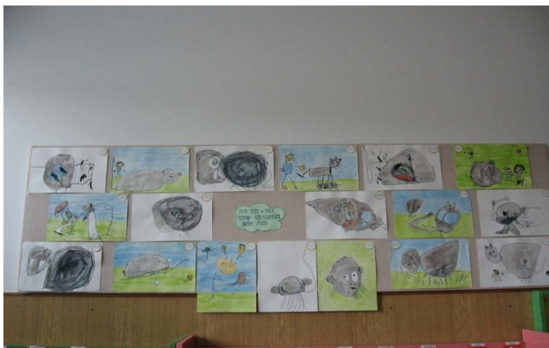
Slika 2: Risbe otrok – volk