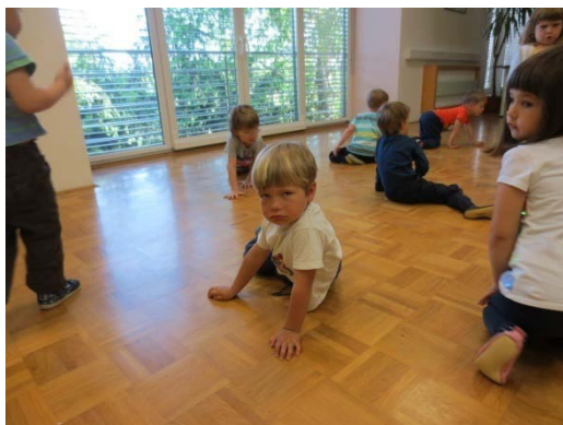
Slika 5: Gibanje volka