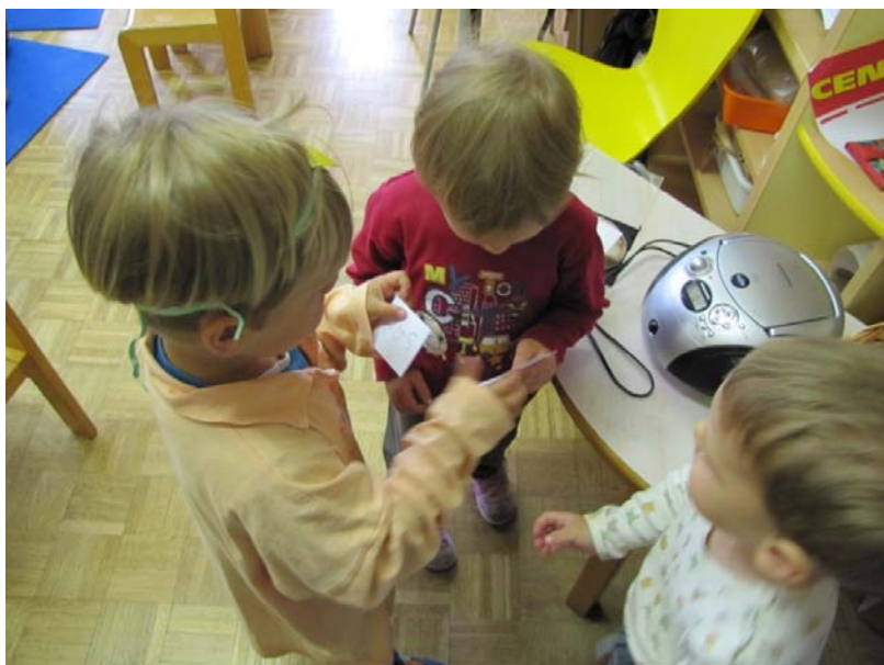
Slika 11: Pobiranje vstopnic