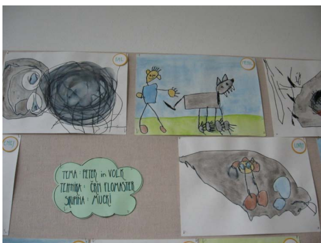
Slika 3: Risbe - volk